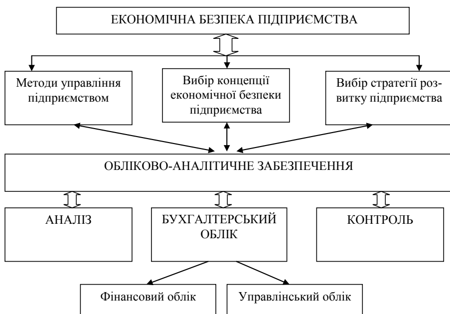
Рис. 1. Складові системи обліково-аналітичного забезпечення

Всі ризики, які можуть виникнути при веденні