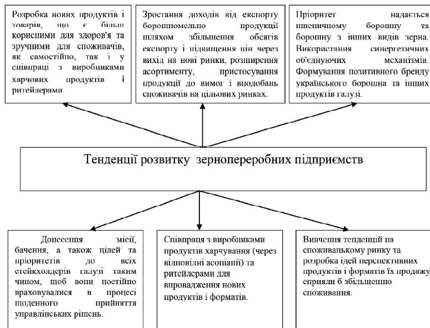
Рис 3. Тенденції розвитку зернопереробних підприємств

зернопереробних підприємств, що актуалізує питання врахування специфіки галузі під час розробки та впровадження заходів управління економічною діяльністю підприємства. Зерновий сектор займає одне з ключових місць в структурі аграрної економіки України [3].