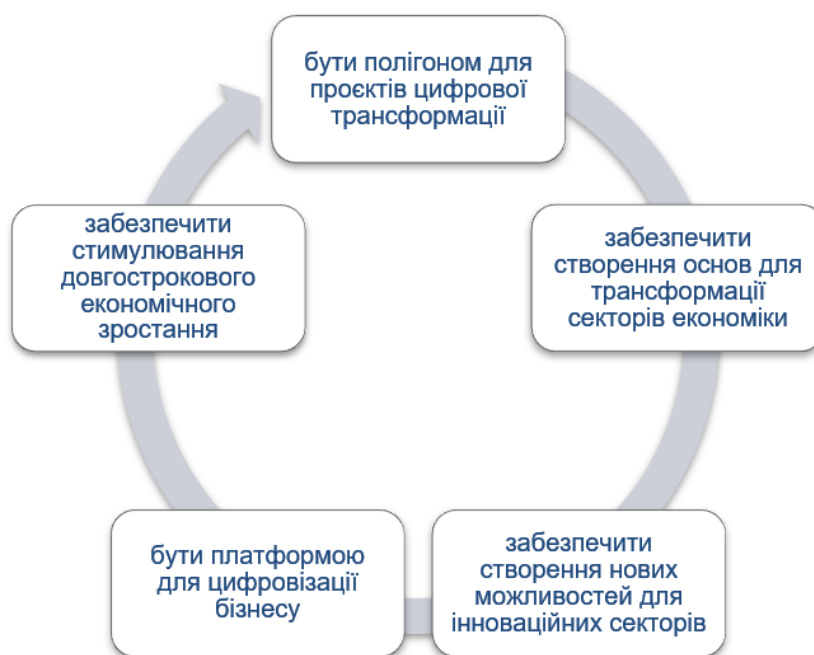
Рис. 3. Перелік пріоритетних цілей діджиталізації економіки України у період у 2024-2025 рр.

Діджиталізація відіграє вадливу роль у формуванні аспектів забезпечення високих рейтингових позицій національної економічної системи за оцінками міжнародних агентств та асоціацій. В контексті трансформаційних зрушень головним складовим елементом виступає високий рівень інвестиційної привабливості держави. У результаті наукового дослідження виявлено, що рівень інвестиційної привабливості України знижується швидкими темпами. Дане явище зумовлено цілою низкою зовнішніх та внутрішніх факторів, вплив яких унеможлиблює високі рейтингові позиції. Враховуючи відповідні тенденції та при умові завершення бойових дій на території держави, - головними цілями діджиталізації економіки України у 2024-2025 рр. є наступні (рис. 3).