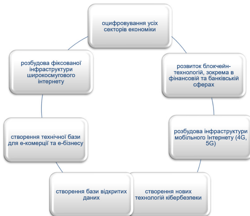
Рис. 1. Перелік основних заходів щодо стимулювання розвитку цифрових трансформаційних процесів в економіці України крізь призму концептуальних засад інвестиційної привабливості

- необхідним є формування низки основних заходів щодо стимулювання розвитку цифрових трансформацій в економіці України (рис. 1).