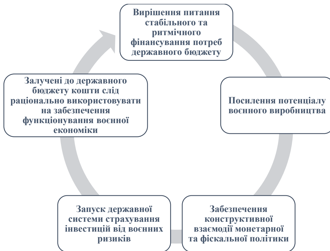
Рис. 3. Шляхи підвищення рівня інвестиційної привабливості економіки України у 2024 р.

Основні складові елементи потенційного стратегічного розвитку відповідних економічних показників та підвищення рівня інвестиційної привабливості економіки України наведені на рис. 3.