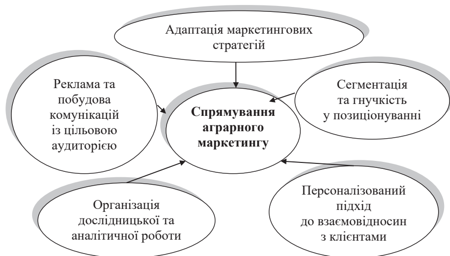
Рис. 2. Коло питань, які охоплює аграрний маркетинг