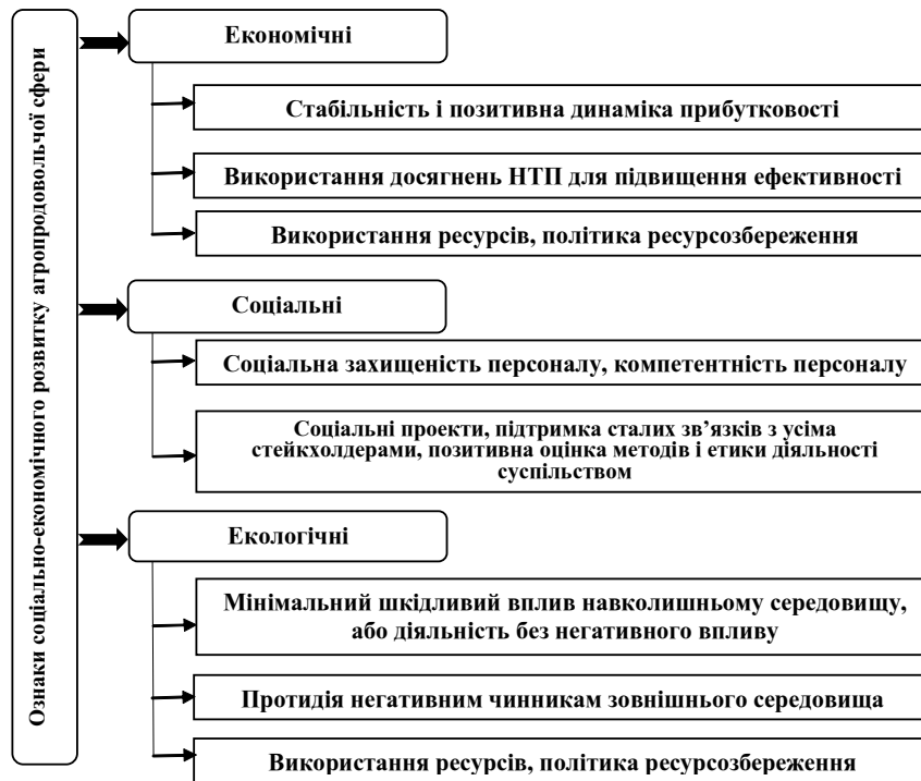
Рис. 2. Ознаки соціально-економічного розвитку в системі адаптивного управління агропродовольчою сферою

адаптивні інвестиції — побудова розвинутої економіки, яка повинна максимізувати ефективне використання ресурсів, при зменшенні виникнення відходів. Співпраця та координація мають відбуватися у напрямку в планування розвитку території, реалізації житлова та транспортна політика, посилення охорони природи, земельних, водних ресурсів та якості повітря;