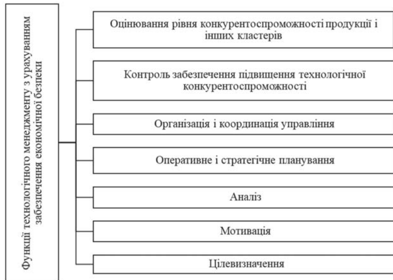
Рис. 2. Основні функції технологічного менеджменту в контексті забезпечення економічної безпеки