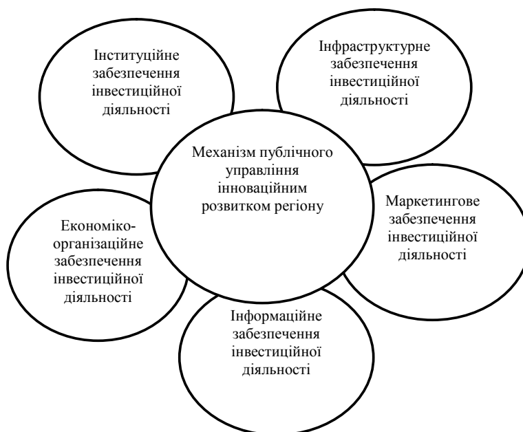
Рис. 2. Структурні компоненти механізму державного управління інвестиційним розвитком регіону

Використання механізму управління інвестиційним розвитком регіону передбачає ефективне використання наявного природно-ресурсного потенціалу; підтримувати розвиток малого та середнього бізнесу через використання міжнародних програм; підвищити інформованість учасників інвестиційного процесу стосовно