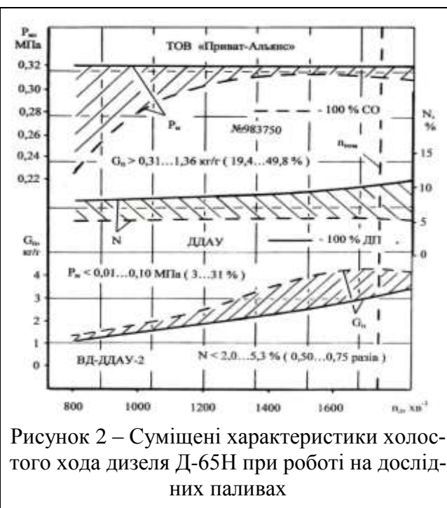
Рисунок 2 – Суміщені характеристики холостого ходу дизеля Д-65Н при роботі на дослідних паливах