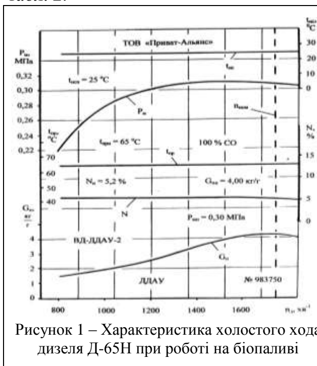
Рисунок 1 – Характеристика холостого ходу дизеля Д-65Н при роботі на біопаливі

Характеристики холостого ходу. На рисунку 1 приведена характеристика холостого ходу при роботі на 100 % СО, а на рис. 2 – суміщені характеристики при роботі на 100 % ДП і 100 % СО, які побудовані за даними табл. 1, табл. 2.