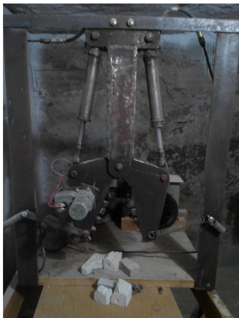
Рис. 2 Гидроножницы с эксцентриковым интенсификатором/ Hydraulic shears with an eccentric mechanism

Для анализа параметров разрушения бетона была создана физическая модель гидроножниц для разрушения бетона с эксцентриковым интенсификатором в масштабе 1:5 (Рис. 2).