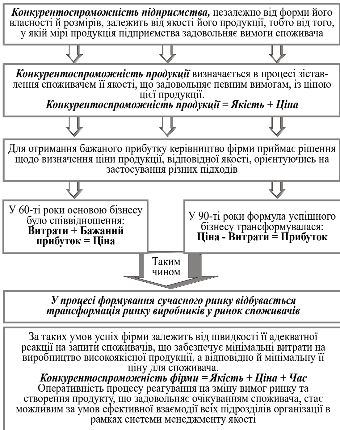
Рис. 1. Значення управління якістю в системі менеджменту: мікроаспект

Слід зазначити, що вести мову про розв'язання проблем якості та необхідність управління цими процесами треба як на державному рівні (макроаспект), так і на рівні підприємства (мікроаспект). На рівні держави проблема підвищення якості стає проблемою підвищення якості життя через забезпечення основних потреб громадян України, гарантованих Конституцією. Значення процесів управління якістю на рівні держави, а також необхідність формування та напрями національної політики щодо якості відображено на рис. 2.