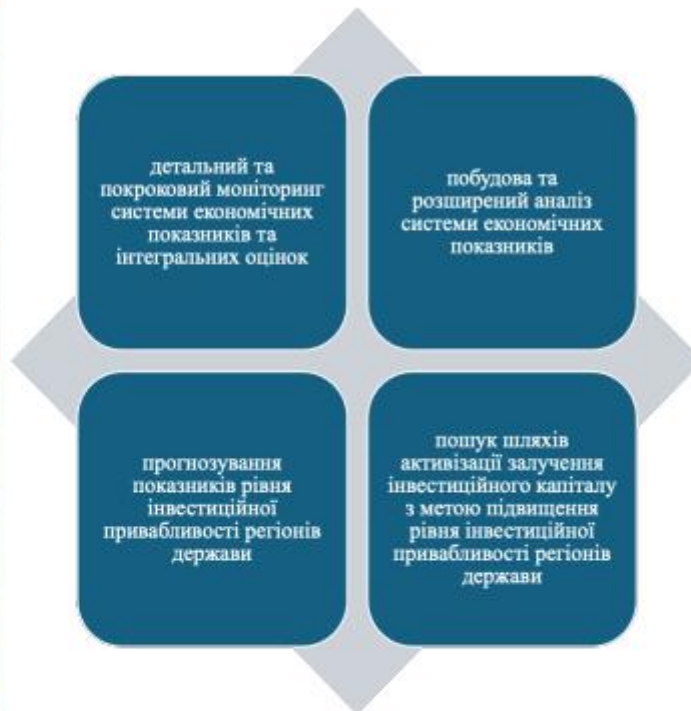
Рис. 1. Хронологічна послідовність відображення рейтингових позицій та економічних показників (теоретичні основи)