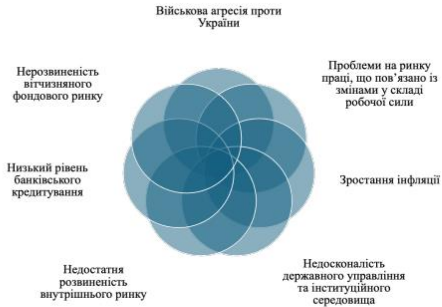
Рис. 4. Основні перешкоди та ризики низької інвестиційної активності в Україні на сучасному етапі

Основними перешкодами та ризиками низької інвестиційної активності в Україні на сучасному етапі є наступні (рис. 4).