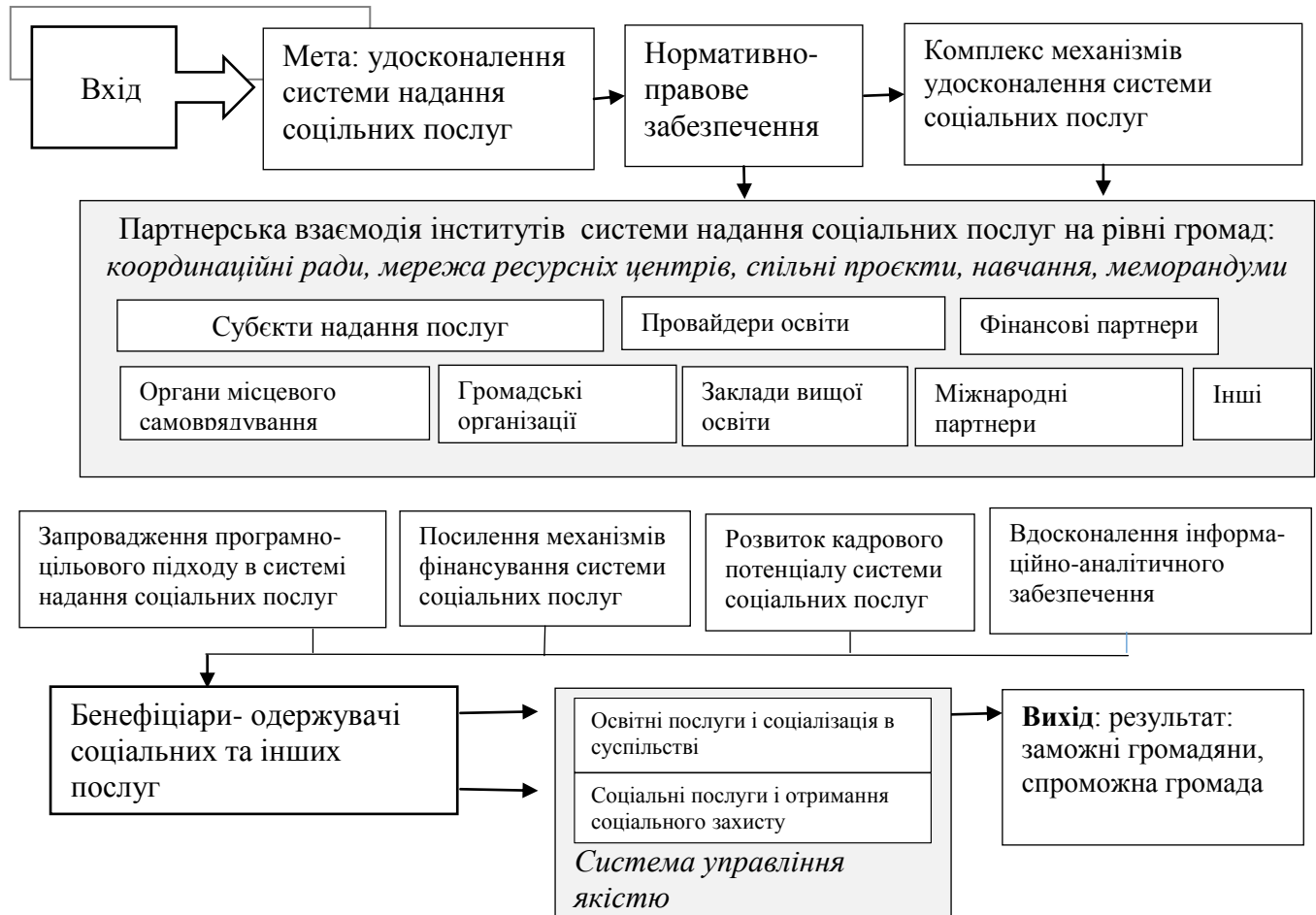
Рис. 3.1. Модель організаційно-управлінського механізму організаційно-управлінського механізму удосконалення системи надання соціальних послуг на основі партнерства ОМС, ГО і залученням ЗВО

представників громадськості. Це дозволить забезпечити об'єктивний моніторинг та постійне вдосконалення послуг.