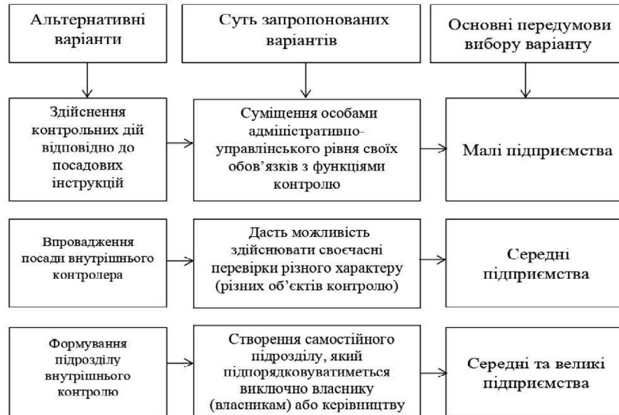
Рис. 1. Варіанти побудови ефективної системи внутрішньогосподарського контролю на підприємствах

му управління. Внутрішній контроль слід організувати з дотриманням принципів доцільності та економічності. Для невеликих підприємств, де кількість працівників і виробнича потужність обмежені, доцільно поєднувати контрольні функції з основними обов'язками кількох управлінців. Для середніх підприємств рекомендуємо запровадити посаду внутрішнього контролера, який зможе виконати перевірку різних напрямків та об'єктів контролю [6].