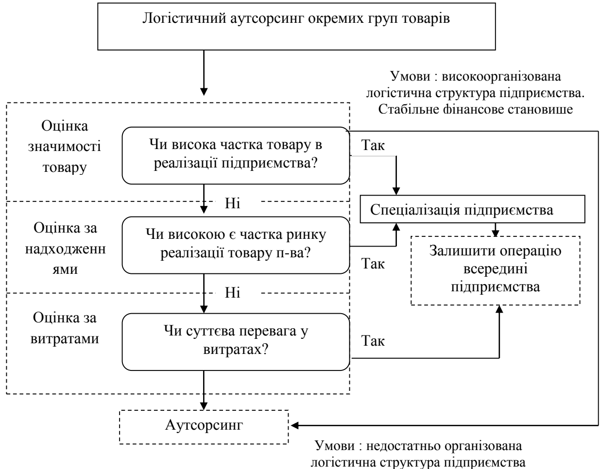
Рис. 1. Алгоритм визначення доцільності передачі функцій на аутсорсинг*

Відповідно, вибір підприємством напряму організації логістичної діяльності необхідно здійснювати згідно алгоритму.