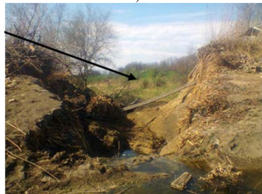
Рис. 3. Руйнування середньої дамби (а) каскаду водойм (поз. 2 на рис. 1); ложе спустошеного ставка (б); формування прорану та обвал ґрунтових мас (в) зі сторони верхнього б'єфу (висота дамби близько 6 м)