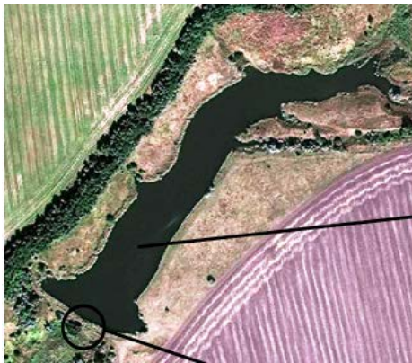
Рис. 2. Верхній ставок (а) каскаду (поз. 1 на рис. 1): колом обведено місце прориву дамби (в) зі сторони нижнього б'єфу; спустошене ложе водойми (б) у верхньому б'єфі.