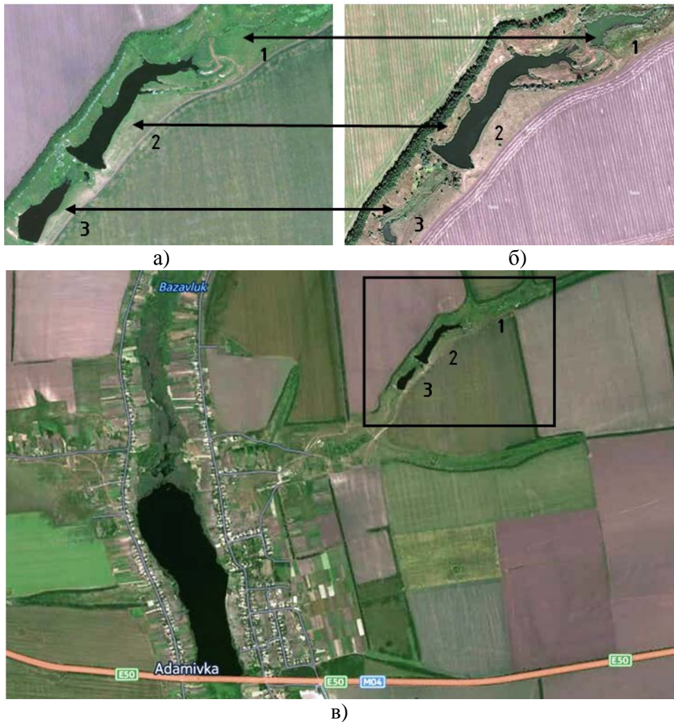
Рис.1. Супутникові знімки території з розташуванням об'єктів досліджень: загальна ситуаційна обстановка (в) знімок із супутника «Here»; каскад ставків – знімок із супутника «Here» (а) та супутника «Яндекс» (б); 1, 2, 3 – номери ставків у каскаді

водойми і подальше зариблення з метою промислового вирощування риби також мала негативний характер. За рахунок потрапляння надмірної кількості відходів зерна та іншої кормової бази, що використовувалась для годівлі риб, відбулось активне забруднення водосховища біогенними речовинами та продуктами їх розпаду. На сьогодні, фактично, водойма не використовується повноцінно для рекреації, тому що купання є небезпечним для здоров'я, а вилов риби заборонений.