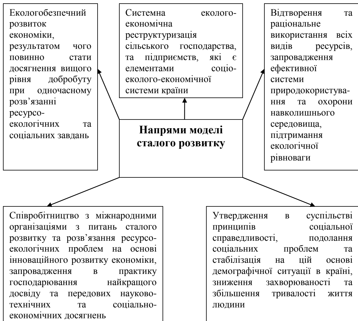
Рис. 3. Основні умови переходу на модель сталого розвитку

Основні умови переходу України на модель сталого розвитку представлені на рис. 3.