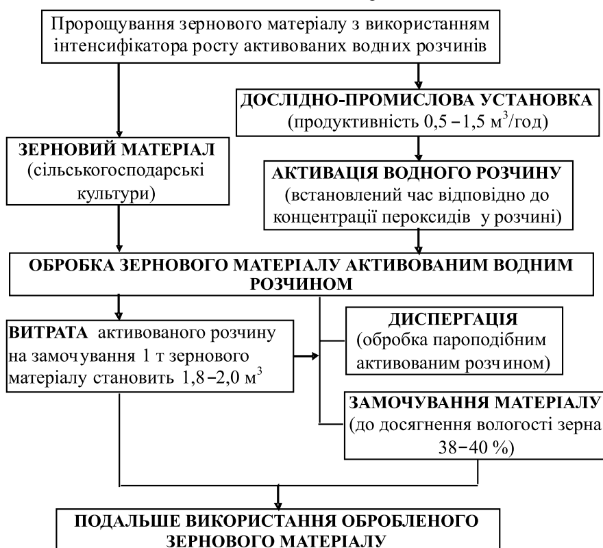
Рис. 3. Принципова схема практичної реалізації отриманих результатів дослідження