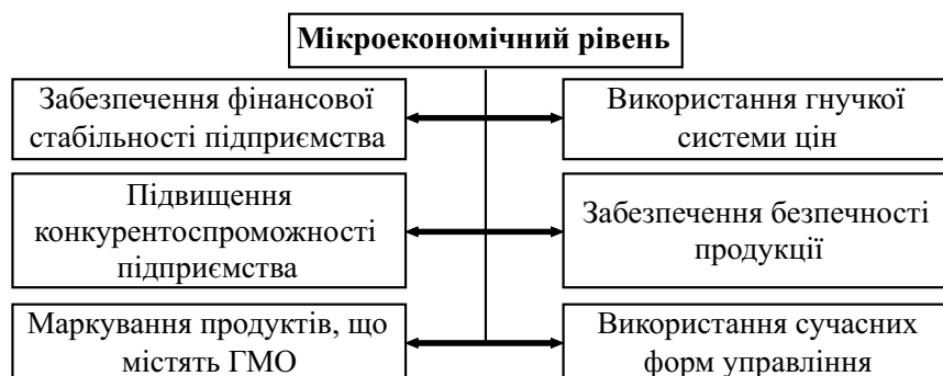
Рис. 3. Мікроекономічні аспекти забезпечення продовольчої безпеки України

продуктів харчування населенням України на рівні науково обґрунтованих норм з подальшим покращенням його структури та підвищення якості продукції вітчизняного виробництва.