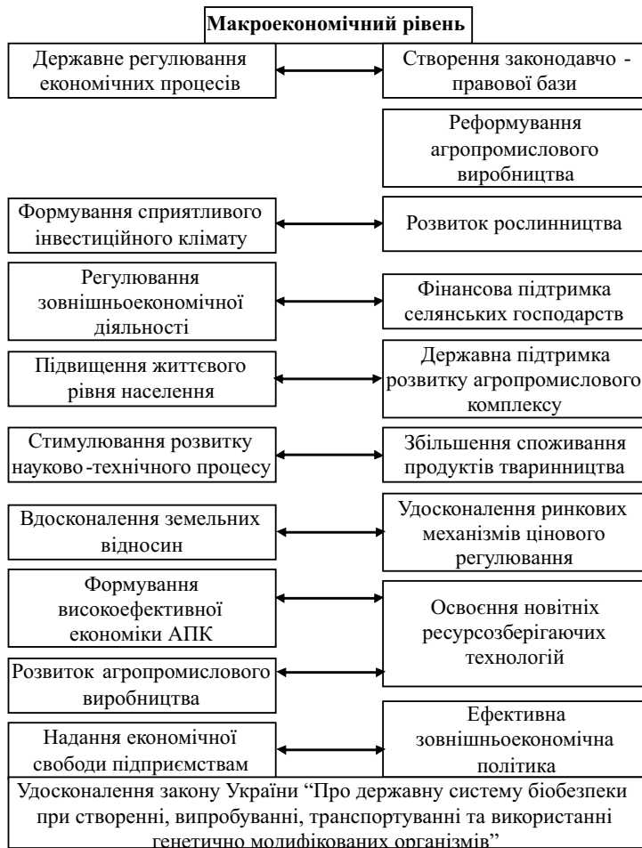
Рис. 2. Макроекономічні аспекти забезпечення продовольчої безпеки України

Метою продовольчої політики держави має стати досягнення споживання основних