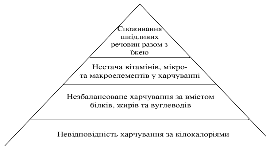
Рис. 1. "Піраміда" рівнів прояву глобальної продовольчої проблеми

економічного розвитку країн світу. Сучасні проблеми людства не виникають самі по собі, а породжуються вже існуючими. Взаємозв'язок глобальних проблем можна порівняти з хімічним терміном "ланцюгова реакція", тобто при зміні будь-якого елемента системи відбуваються зміни і в інших її складових. Глобалізація є однією з підстав виникнення та розповсюдження глобальних проблем, але, з іншого боку, глобалізаційні процеси можуть стати запорукою вирішення проблем світового масштабу, тому що подолання негативних явищ такого роду неможливе без зусиль усієї світової спільноти. Кожна глобальна проблема має економічне підґрунтя, через що для подолання будь-якої з них необхідне дотримання пріоритетних напрямів економічного розвитку світового господарства.