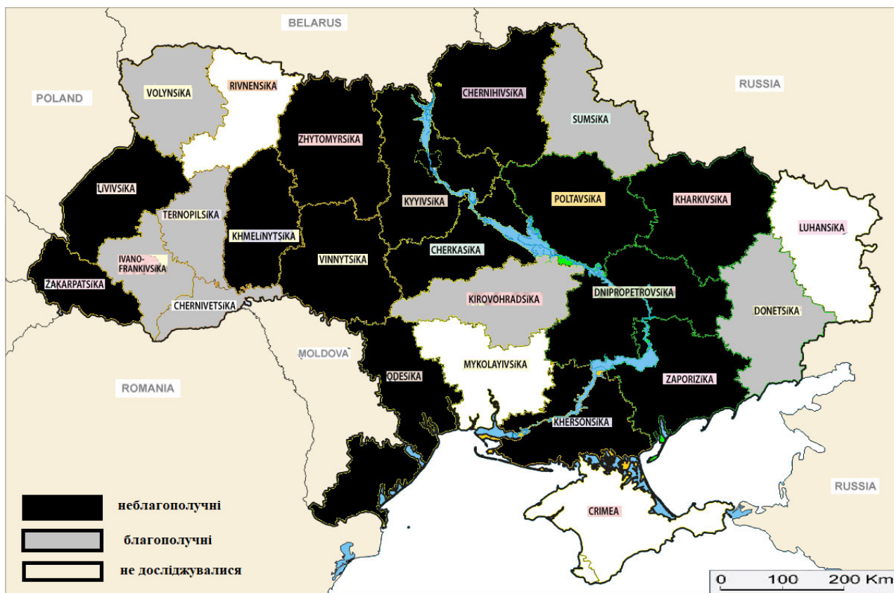
Рис. 1. Карта епізоотичної ситуації щодо епідемічної діареї свиней в Україні за результатами досліджень НДЦ біобезпеки та екологічного контролю ресурсів АПК ДДАЕУ упродовж 2015–2018 рр.

Під час моніторингових досліджень в Україні ЕДС було підтверджено в 14 (66,67%) з 21 регіону України: Вінницькому, Дніпропетровському, Закарпатському, Запорізькому, Житомирському, Київському, Львівському, Полтавському, Одеському, Харківському, Херсонському, Хмельницькому, Черкаському та Чернігівському. Благополучними щодо ЕДС були свиногосподарства Волинського, Івано-Франківського, Тернопільського, Чернівецького, Донецького та Сумського регіонів (рис. 1).