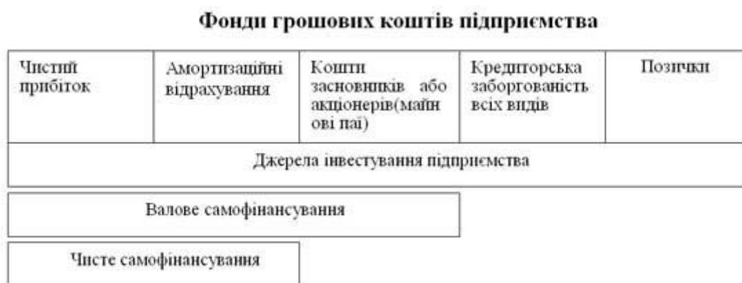
Рис. 2. Валове і чисте самофінансування у системі грошових фондів підприємства.

Таким чином, мова йде про формування і використання грошового потоку підприємства, отриманого від виконання основної діяльності, та інших фінансових ресурсів, які прирівнюються до власних (рис. 2.).