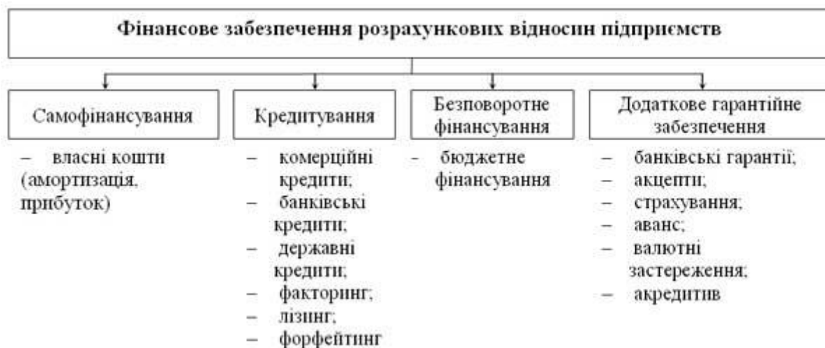
Рис. 1. Класифікація форм фінансового забезпечення розрахункових відносин у зовнішньоекономічній діяльності підприємств [11]

Науковець Пластун В.Л. вважає, що фінансове забезпечення діяльності підприємств, яке справедливо відзначається більшістю дослідників, може проводитись за рахунок самофінансування, кредитування, безповоротного фінансування. Це дає можливість розширити класифікацію форм фінансового забезпечення та використовувати їх в цілях відтворення основних засобів інструментами додаткового гарантійного забезпечення (рис. 1).