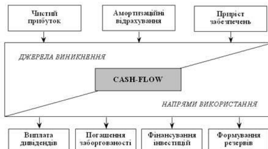
Рис. 3. Формування операційного грошового потоку Cash-flow

Структурно-логічна схема виникнення та використання операційного Cash-flow наведена на рис. 3.