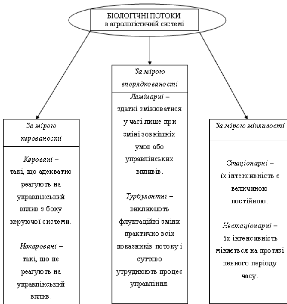
Рис. 2 Класифікація біологічних потоків агрологістичної системи за основними ознаками