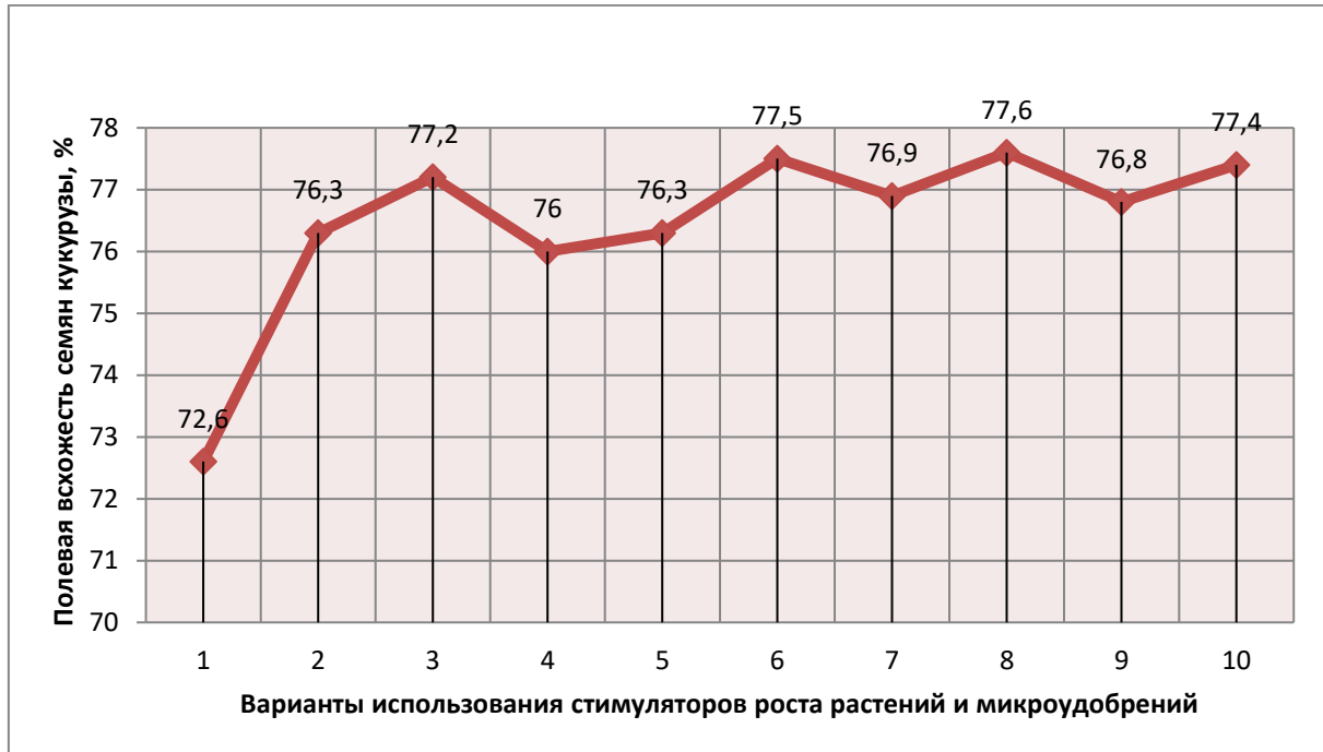
Рисунок 1. Полевая всхожесть семян кукурузы в зависимости от применения регуляторов роста растений и микроудобрений в среднем за 2013-2015 гг., %.

В среднем за три года исследований была отмечена тенденция к росту полевой всхожести семян в вариантах его инкрустации Вымпел-К на 3,4-5,0% по сравнению с контролем (без инкрустации) (рис. 1). Появление дружных всходов в оптимальные сроки дает возможность растениям при высоких температурах в мае сформировать полноценный первый и последующие листья, что немаловажно на старте роста и развития растения кукурузы, особенно в засушливых условиях Степи.