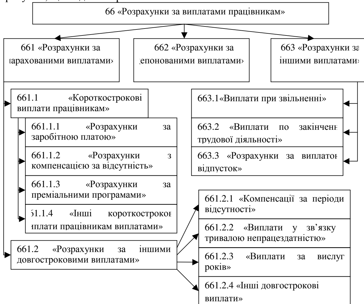
Рис. 1. Схема уніфікованого рахунку 66 «Розрахунки за виплатами працівникам»

На підприємствах синтетичний облік розрахунків за виплатами працівникам ведеться на рахунку 66 «Розрахунки за виплатами працівникам». Отже, що через рахунок 66 здійснюються виплати сум, які не можна чітко ідентифікувати із заробітною платою, необхідно до рахунку відкрити субрахунки, що подані на рис. 1.