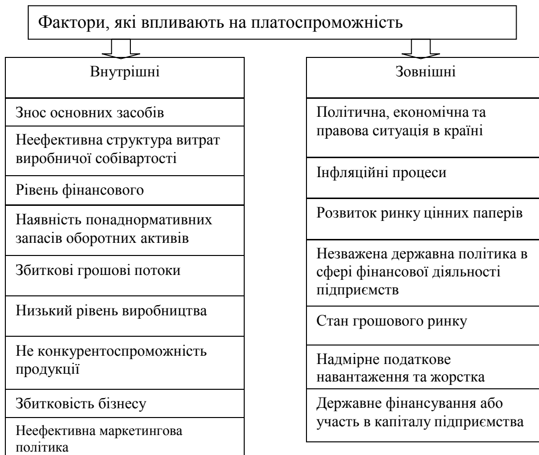
Рис. 1. Фактори, які впливають на платоспроможність підприємства

Важливе значення для підприємства мають і фактори, що впливають на формування його ліквідності. Підприємство повинне регулювати наявність ліквідних засобів у межах оптимальної потреби в них, яка для кожного конкретного підприємства залежить як від зовнішніх, так і від внутрішніх факторів [1, с.368]. На думку окремих авторів до факторів, що впливають на ліквідність підприємства можна віднести наступні, представлені на рис. 2.