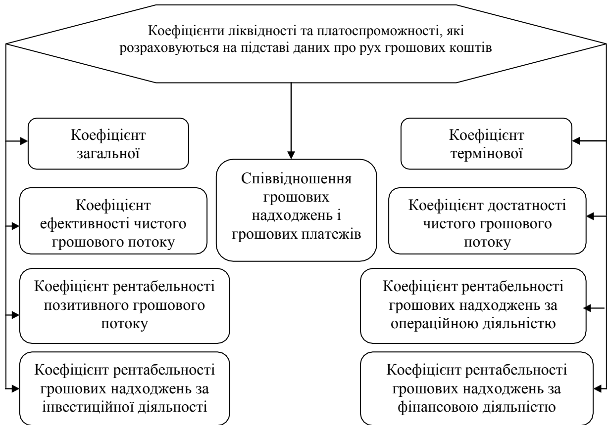
Рис. 3. Коефіцієнти ліквідності та платоспроможності, які розраховуються на підставі даних про рух грошових коштів.

протягом найближчого півріччя; якщо коефіцієнт < 1 , те такої можливості в підприємства немає [3, с.78].