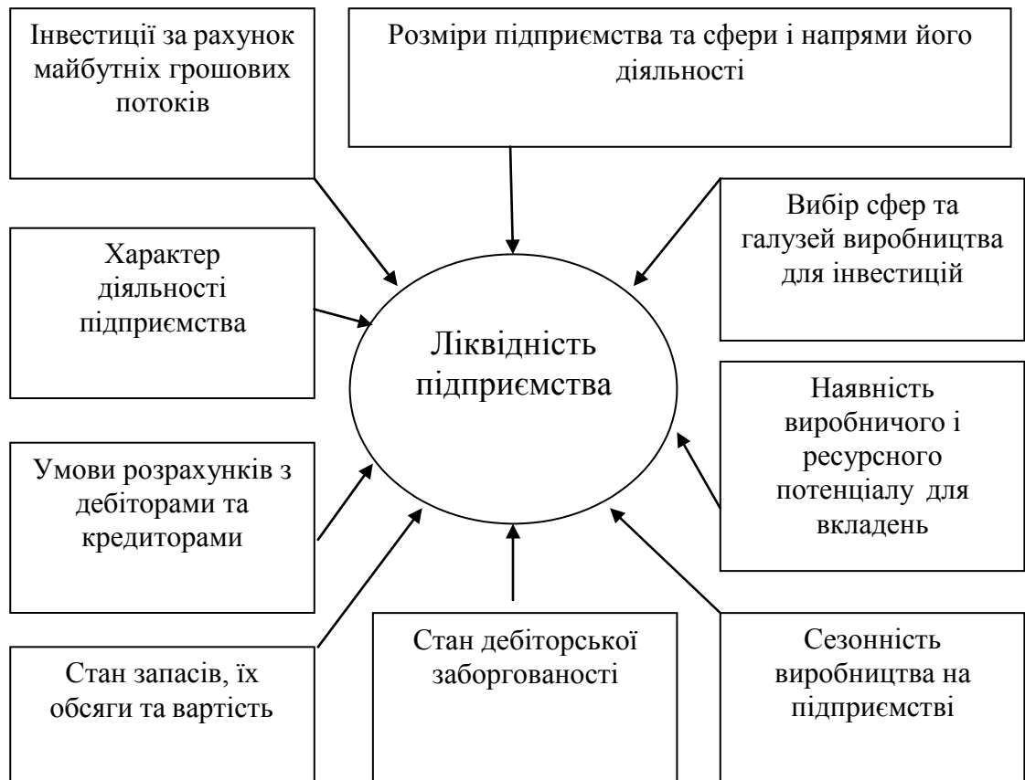
Рис. 2. Фактори, що впливають на ліквідність підприємства

Для більш глибокого вивчення факторів, що виляють на платоспроможність і ліквідність підприємства проаналізуємо спрямованість їх впливу.