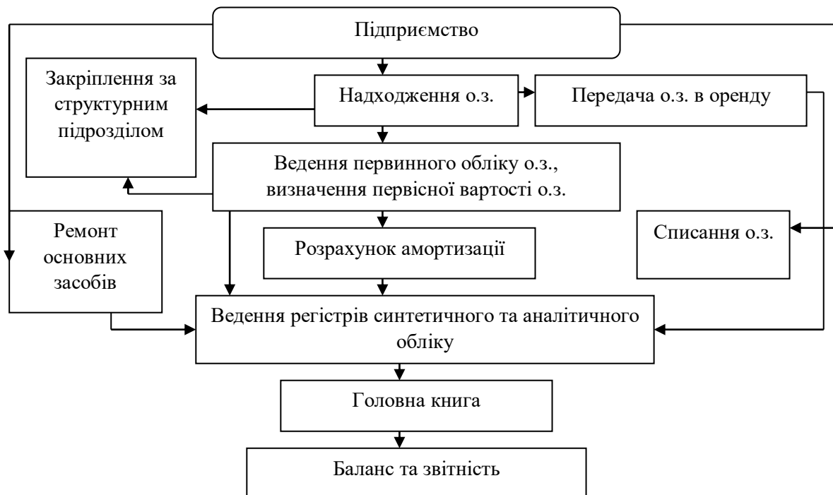
Рис. 2. Теоретичний аспект обліку надходжень і рухів основних засобів

Дані на рисунку 2 показують, що теоретичні особливості обліку основних засобів включають їх ретельну угруповання, аналіз, зберігання, переміщення і використання протягом усього операційного циклу, супроводжувані рядом первинних документів, реєстрів бухгалтерського обліку, а також звітності підприємства.