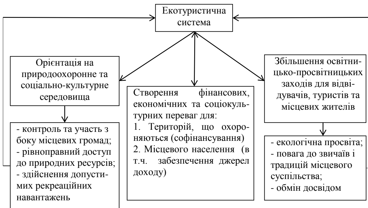
Рис.1.2. Функціонування елементів екотуристичної системи

Екологічний туризм інтегрує об'єкти рекреаційної діяльності та спрямовує їх на гармонізацію відносин між відпочиваючими та природним середовищем, що реалізується через екологізацію всіх видів туристичної діяльності, охорону природи, освіту та виховання [237]. Туристична галузь України є неконкурентоспроможною через застарілу матеріально-технічну базу, відсутність розвиненої туристичної інфраструктури та висококваліфікованих кадрів, орієнтування туристичних агенцій області на виїзний туризм, податковий тиск та вкрай низький рівень держаної підтримки, спрямованої на підвищення інвестиційної привабливості та стимулювання продажу національного турпродукту як для внутрішнього так і для зовнішнього ринків. Подолання цих проблем стане можливим за допомогою активного функціонування елементів екотуристичної системи (рис. 1.2.)