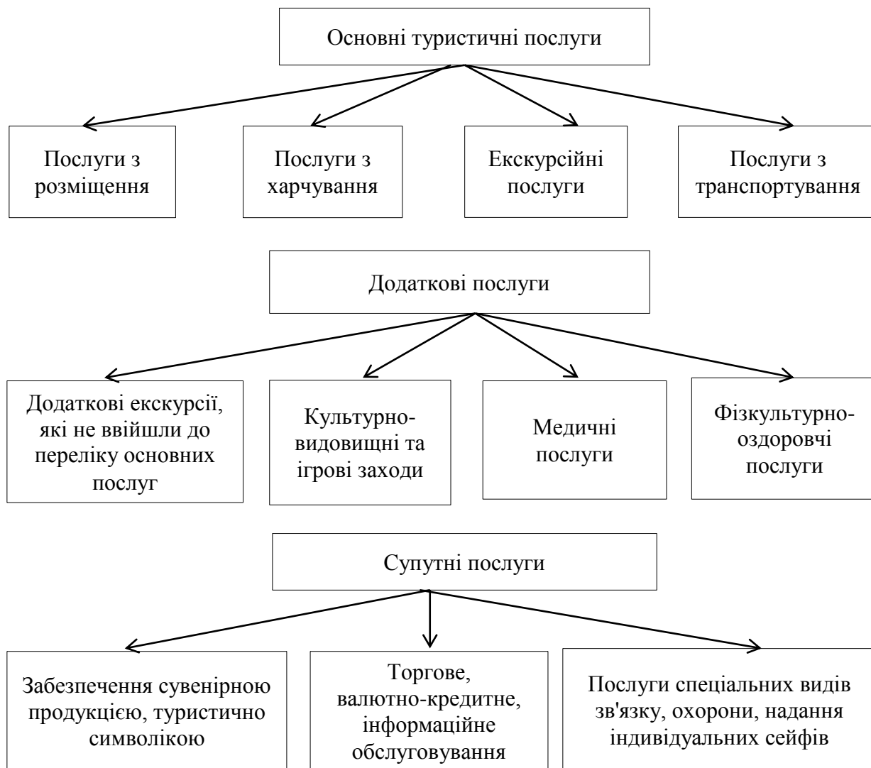
Рис. 1.3. Класифікація надання туристичних послуг в системі екотуристичної інфраструктури

Система екотуристичної інфраструктури представлена наступною класифікацією (рис.1.3)