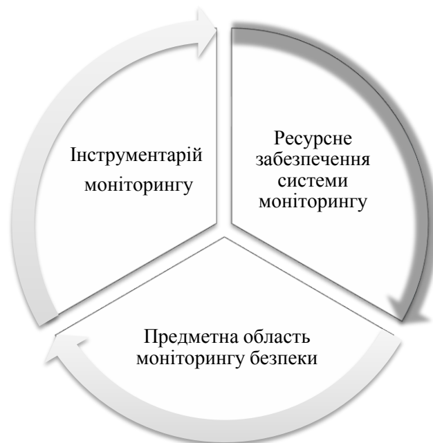
Рис 2. Основні елементи системи моніторингу економічної безпеки підприємства

Опрацьовані літературні джерела та дослідження практики діяльності суб'єктів господарювання, дозволяє визначити основні елементи системи моніторингу економічної безпеки підприємства (рис. 2.).