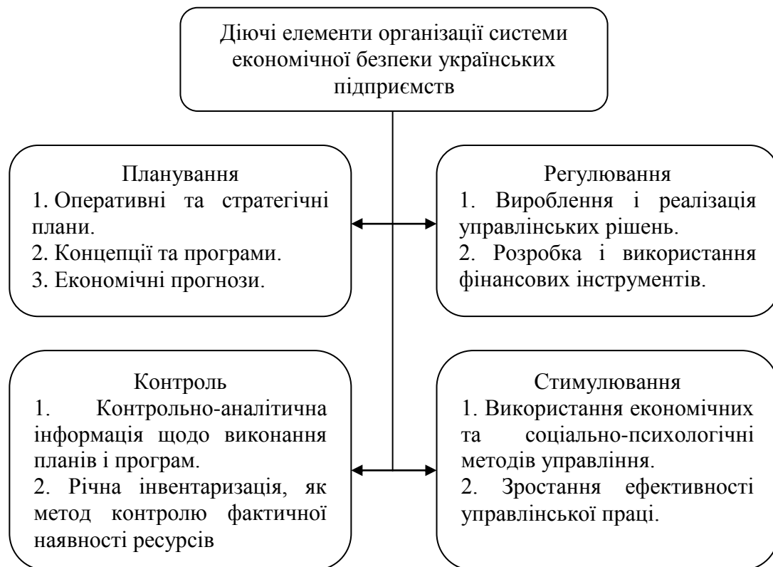
Рис. 1. Основні елементи організації системи економічної безпеки українських підприємств

На сьогоднішній день, як уже зазначалося, окремої служби безпеки не створено на більшості українських підприємств. В той же час, дослідження засвідчили, що їх успішне функціонування досягається, в основному, підходами до управління підприємством та вдалою організацією функціонування його структурних підрозділів. Така організація, за своєю суттю представляє компоненти організації системи економічної безпеки підприємства, які уже на сьогодні застосовуються суб'єктами господарювання (рис. 1).