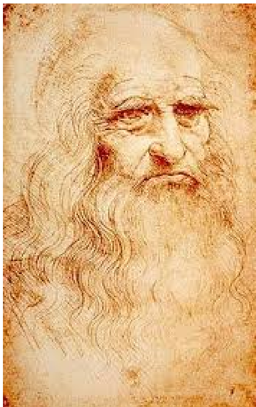
Ймовірний автопортрет Леонардо да Вінчі