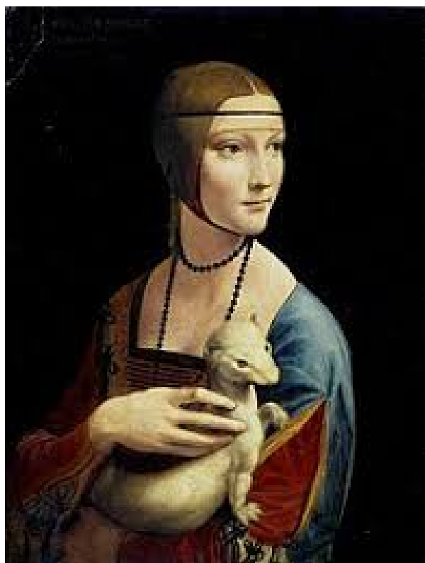
Леонардо да Вінчі, «Дама з горностаєм», 1490, Національний музей, Краків

Леонардо першим пояснив, чому небо синє. У книзі «Про живопис» він писав: «Синява неба відбувається завдяки товщі освітлених частинок повітря, яка розташована між Землею і знаходиться вгорі чорнотою».