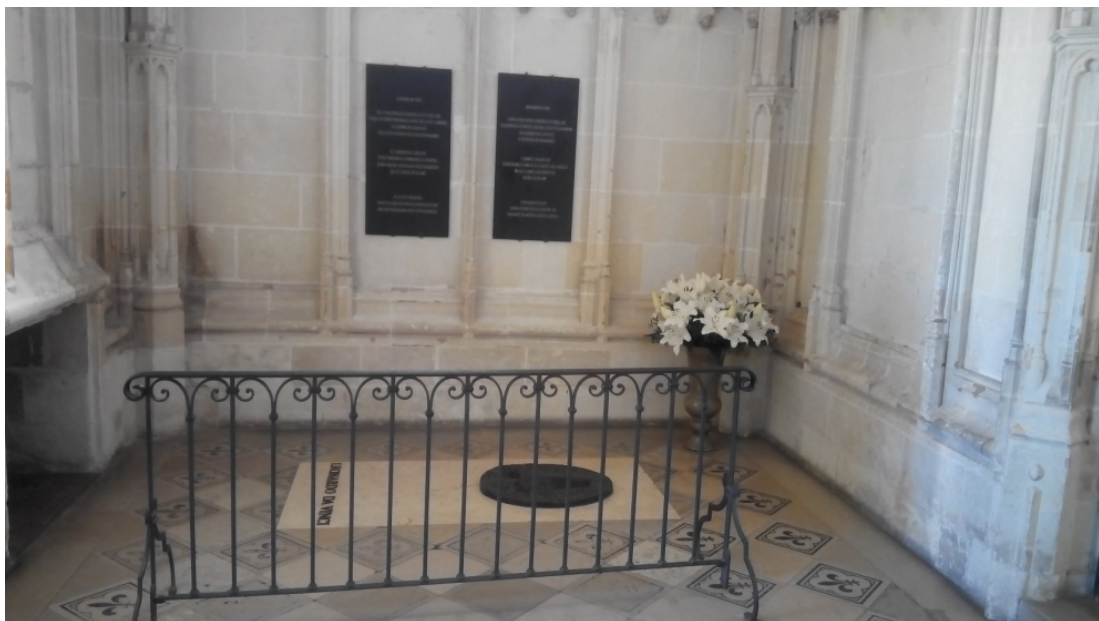
Могила Леонардо да Вінчі в замку Амбуаз (Франція)

«Не обертається той, хто спрямований до зірки», – писав Леонардо.