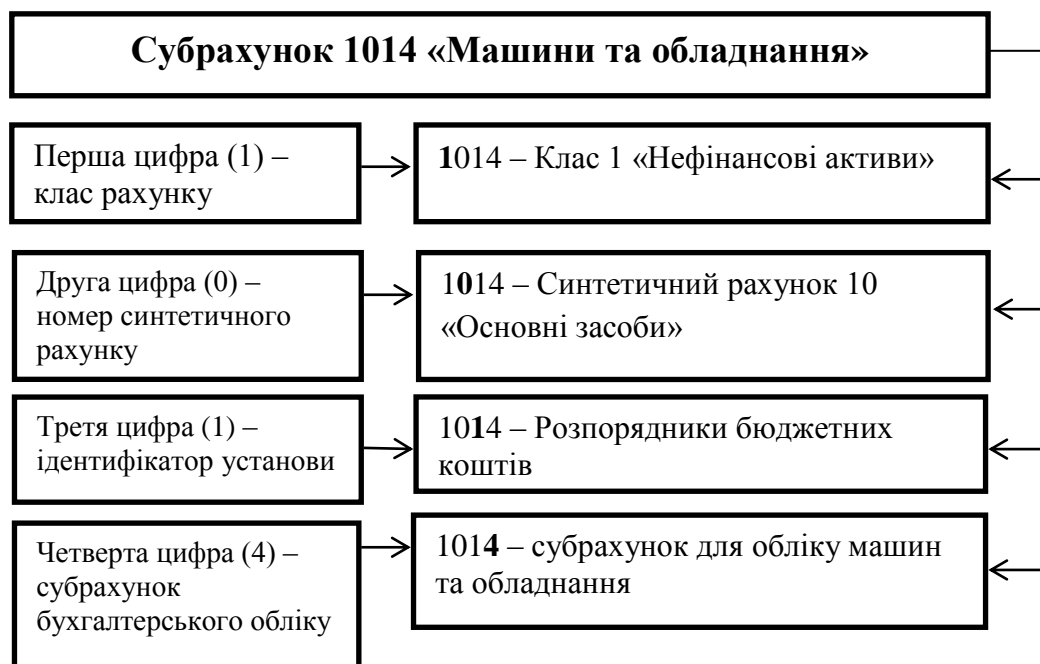
Рис. 2. Характеристика субрахунку 1014 «Машини та обладнання»

Отже, кореспонденція рахунків, яка затверджена Наказом МФУ №1219 дуже загальна, вона не враховує всі можливі господарські операції, на нашу думку, державним установам доцільно затвердити власну кореспонденцію субрахунків (з урахуванням галузевих особливостей і додатково введених аналітичних рахунків) як додаток до наказу про облікову політику.