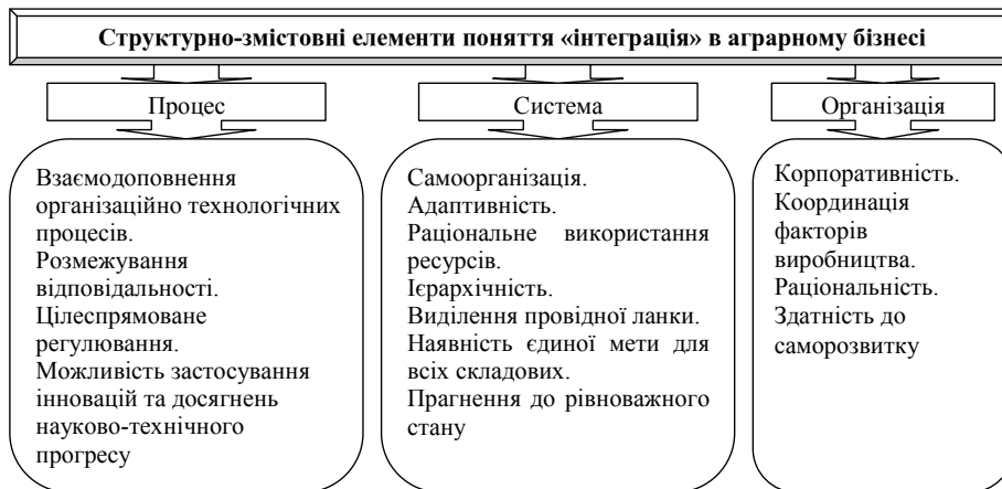
Рис. 2. Структурна характеристика суті поняття "інтеграція"

ується процесно-складовий підхід, обумовлений поділом сфер діяльності, який дозволив визначити сутність інтеграції як процесу, системи та структури (рис. 2).