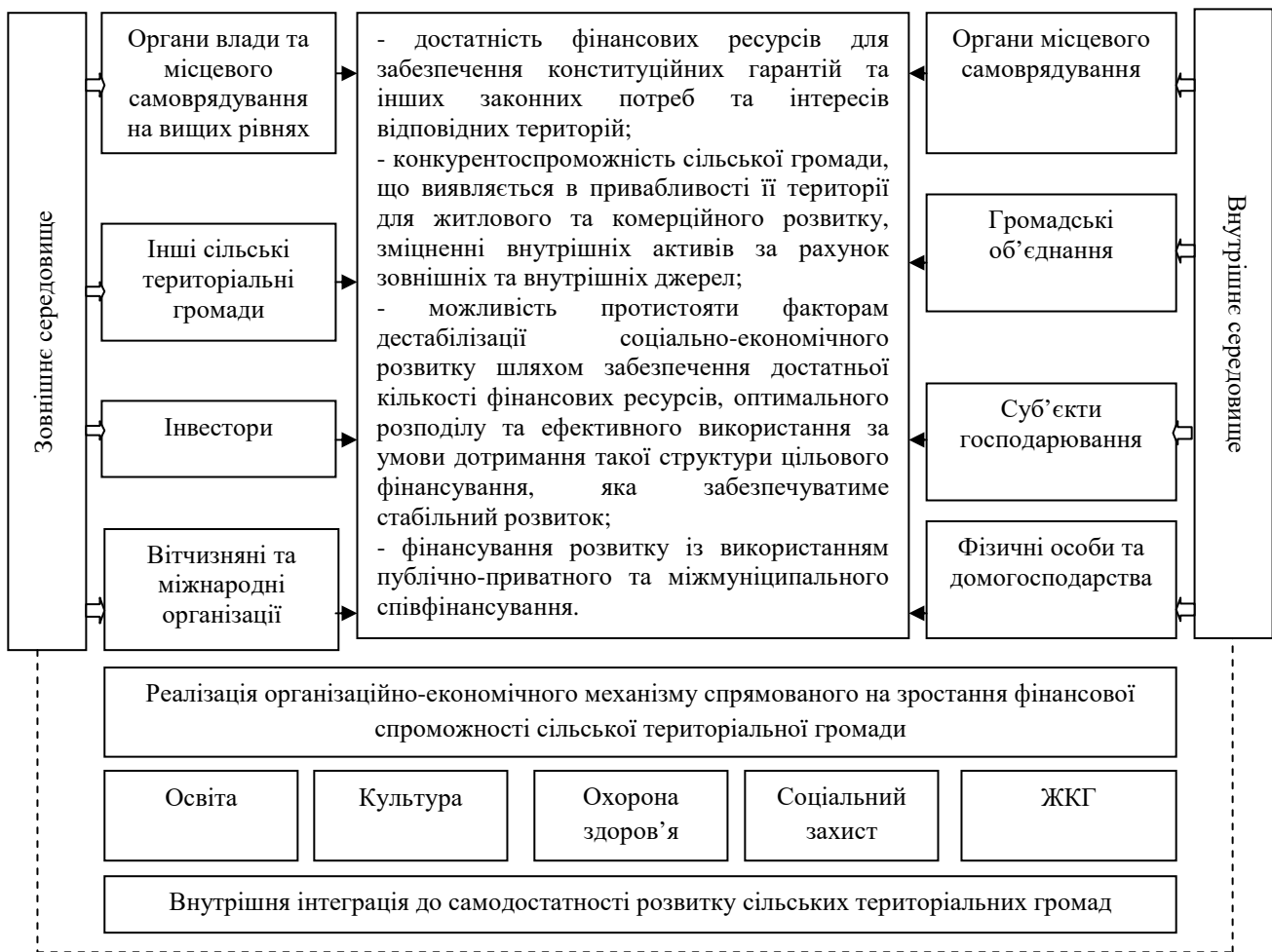
Рис. 3. Основні чинники та критерії внутрішньої інтеграції та зростання фінансової спроможності сільської територіальної громади в організаційно-економічному механізмі їх розвитку

Джерело: удосконалено авторами за даними [15; 20]