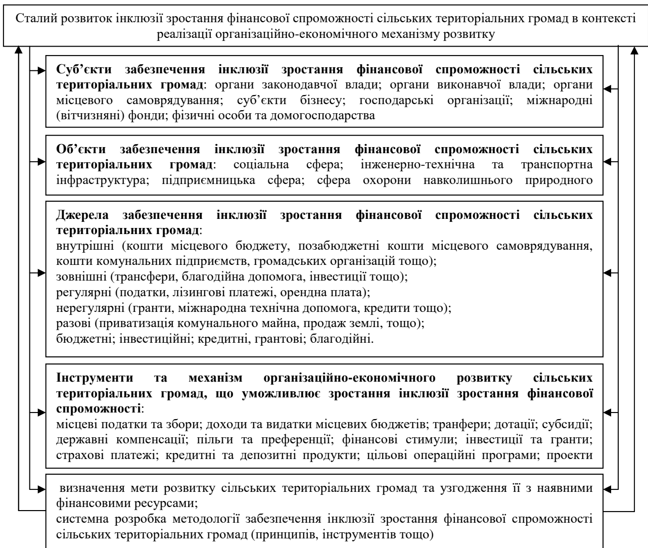
Рис. 2. Модель зростання фінансової спроможності сільських територіальних громад

Бюджетний вектор розвитку забезпечується за допомогою програмно-цільового методу, який систематизує: формування середньострокового бюджетного плану, надання якісних послуг населенню через оптимальне використання бюджетних коштів; підвищення обізнаності громадськості щодо ефективності видатків бюджету громади в сільській території; задоволення споживачів соціальних послуг через системні елементи фінансово-економічного потенціалу [3, с. 28]. Така система дозволяє налагодити цілеспрямовану організацію фінансової спроможності СТГ, враховуючи ефективність взаємовідносин зацікавлених суб'єктів бізнесу в економічному зростанні сільських громад (рис. 2).