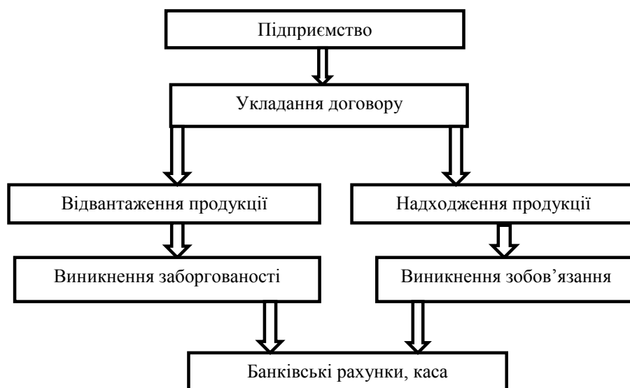
Рис. 2. Схема організації операцій з покупцями та замовниками