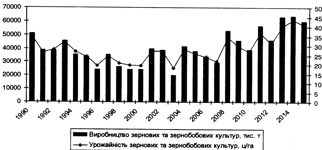
Рис. 3 Динаміка показників вирощування зернових та зернобобових культур в Україні

Продовольчі сільськогосподарські культури діляться на зернові (кукурудза, пшениця, сорго, рис, просо); бобові (квасоля, горох, нут, тощо); і, коренеплоди (картопля). Основні продовольчі культури - кукурудза, рис, пшениця, сорго, картопля, соняшник, овочі і боби. На рис. 3 розглянемо динаміку показників вирощування зернових та зернобобових культур в Україні.