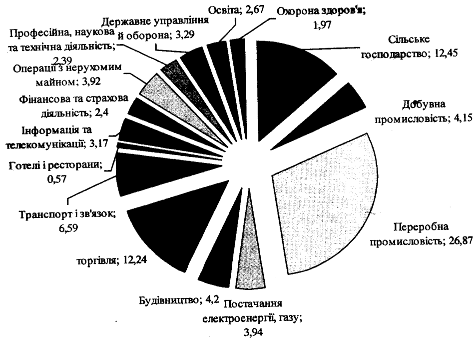
Рис. 1 Питома вага галузей в народному господарстві України у 2015 році, %

Сільськогосподарська галузь включає в себе такі підгалузі та підсектори: рослинництво, тваринництво, рибальство, земля, вода, кооперативи, навколишнє середовище, регіональний розвиток та лісове господарство. Таким чином, є багато гравців і зацікавлених сторін у секторі через його ролі в економіці та його сільській природі, що стосується життя багатьох людей. На рис. 2 подана класифікація видів економічного потенціалу сільськогосподарської галузі України.