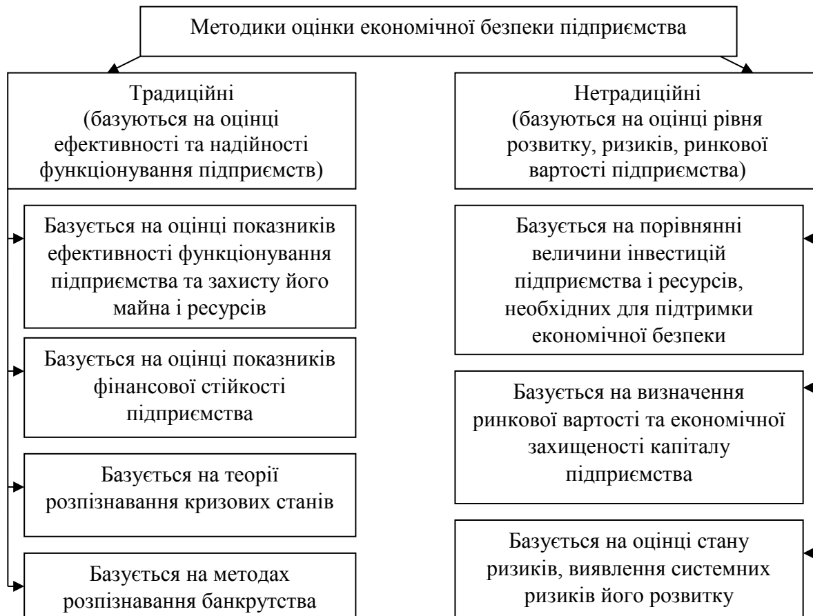
Рис. 2. Методичні підходи до оцінки рівня економічної безпеки підприємства

Такі методи в роботах М. В. Рей, А. О. Іванова (рис. 2) також недосконалі: їх загальний недолік – проблема розстановки пріоритетів відповідних показників оцінки, трудомісткість проведення та інтерпретації результатів оцінки.