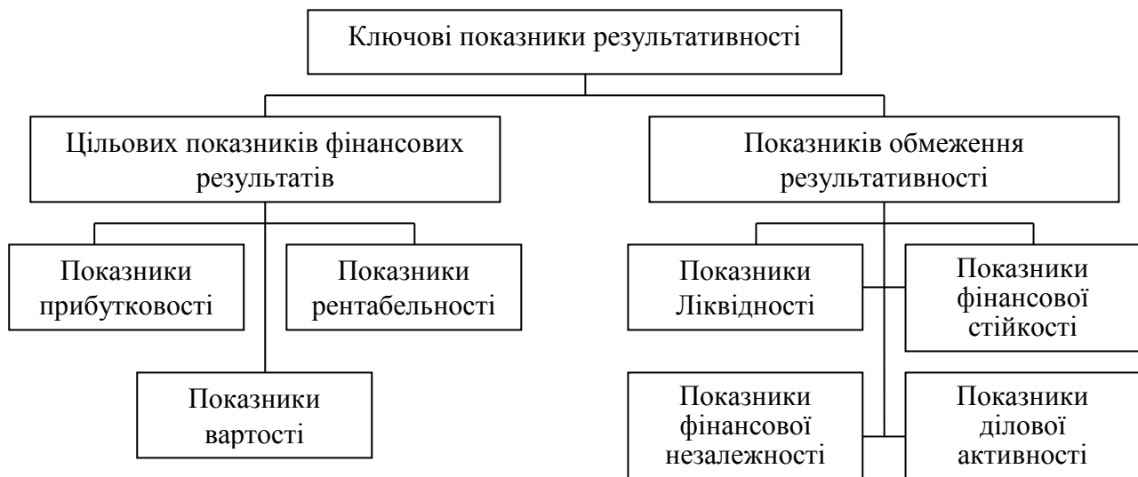
Рис. 1. Структура ключових показників результативності

Необхідно наголосити, що представлений склад цільових показників фінансових результатів повною мірою кореспондується з однією з основних базових концепцій фінансового менеджменту – концепцією компромісу між ризиком та прибутковістю.