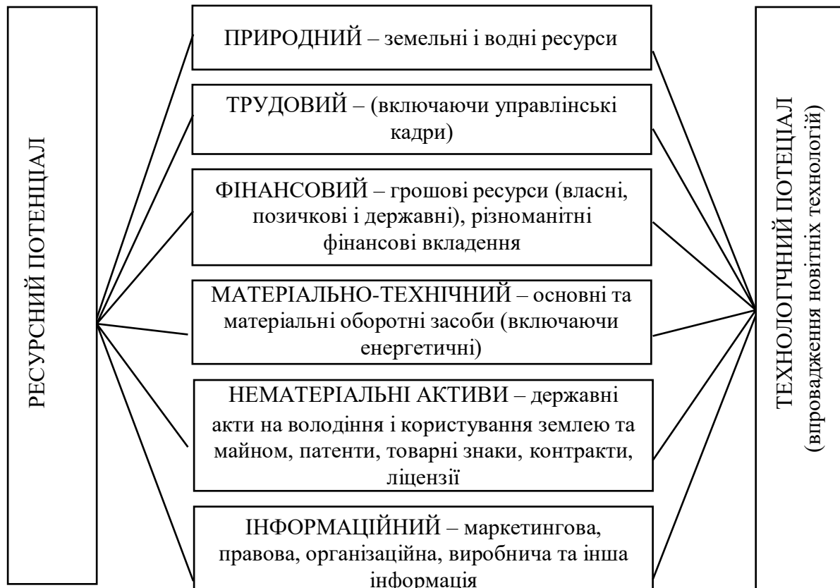
Рис. 1. Складові ресурсного потенціалу аграрного підприємства