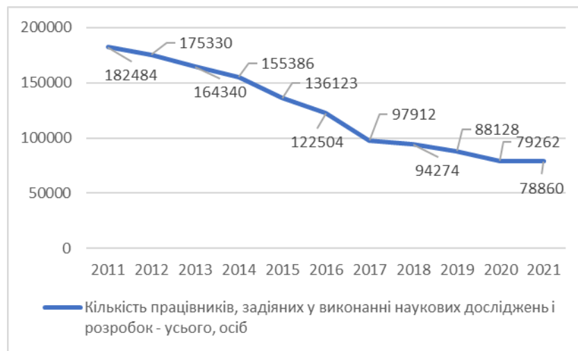
Рис. 2 Зміна загальної кількості працівників, задіяних у виконанні наукових досліджень і розробок, за 2011-2021 роки

Отже, можна узагальнити, що сьогодні в Україні існують наступні проблеми, що стримують розвиток інноваційної активності вітчизняних підприємств: