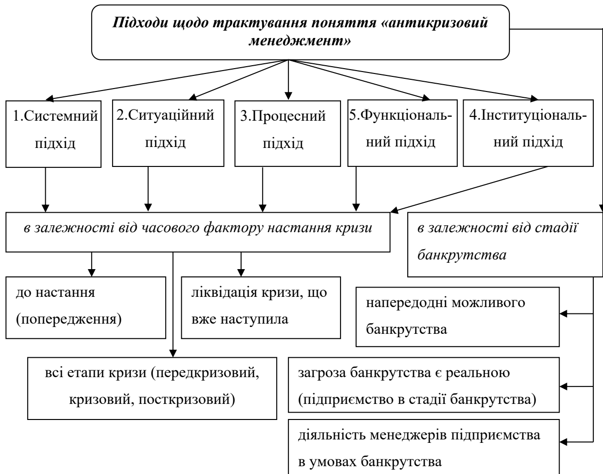
Рис. 2. Систематизація підходів щодо трактування поняття «антикризовий менеджмент»