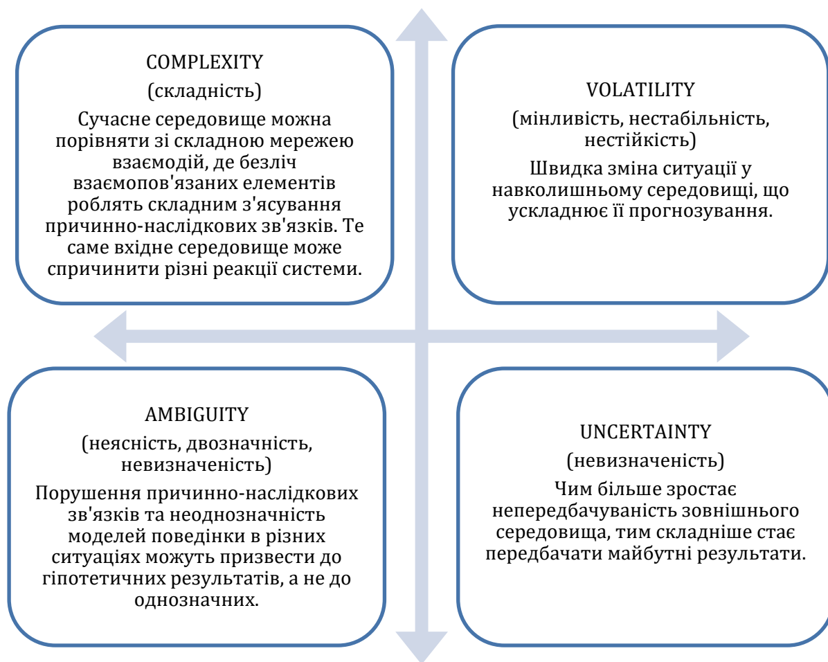
Рис. 2. Характеристика складників VUCA – світу в економічному контексті Джерело: [10].

Цифрові технології є надзвичайно важливим інструментом у сучасному економічному менеджменті. Вони дають можливість підприємствам збирати, аналізувати та використовувати великі обсяги даних для прийняття рішень на основі обґрунтованих даних. Цифрові технології також дають змогу ефективно взаємодіяти зі своїми клієнтами, підвищувати ефективність маркетингових кампаній та розвивати нові продукти та послуги [4].