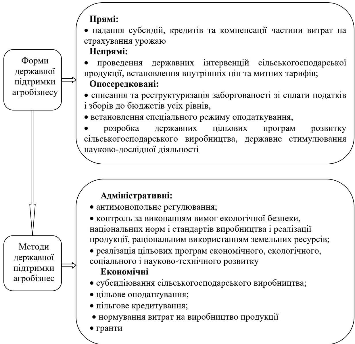
Рис. 1. Система державної підтримки агробізнесу

регулювання, зменшення адміністративного навантаження на підприємства, імплементація та поєднання законодавства з нормами ЄС, а також зниження корупційних ризиків в існуючих процедурах» [5].