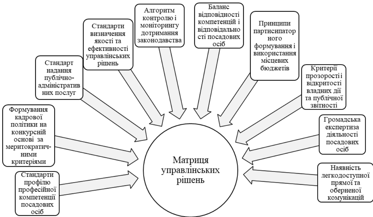
Рис. 4.7. Концепція матриці управлінських рішень за ОМС в умов формування громадянського суспільства

Метою запровадження матриці є забезпечення сталого розвитку територіальних громад. Матриця складається з кількох змістовно-функціональних блоків, забезпечує єдиний підхід до прийняття рішень у публічному управлінні, чим усуває їх варіативність і упередженість, мінімізує корупційну складову тощо. Концепцію такої матриці наводимо на рис. 4.7.