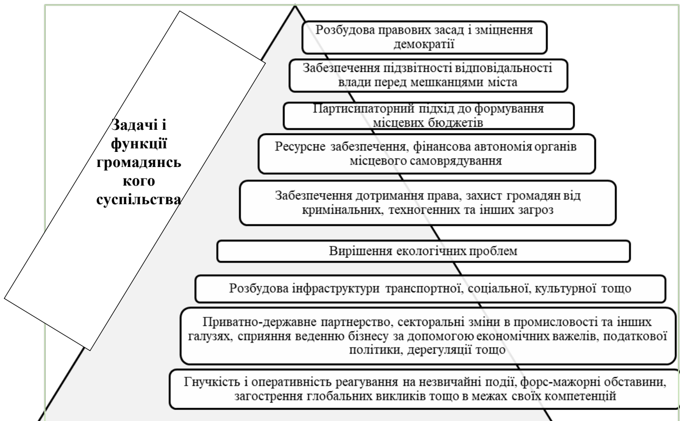
Рис. 4.6. Задачі і функції громадянського суспільства як інструменту сталого розвитку територіальних громад

Зазначимо, що громадянське суспільство в Україні лише починає формуватися. Про це свідчить активізація громадських виступів, започаткування і розвиток добровольчих рухів, формальне і неформальне об'єднання активістів, волонтерський рух, створення громадянських організацій тощо.