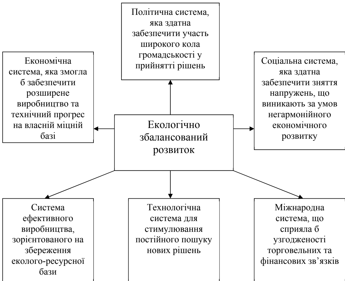
Рис. 2. Системи формування екологічно збалансованого розвитку