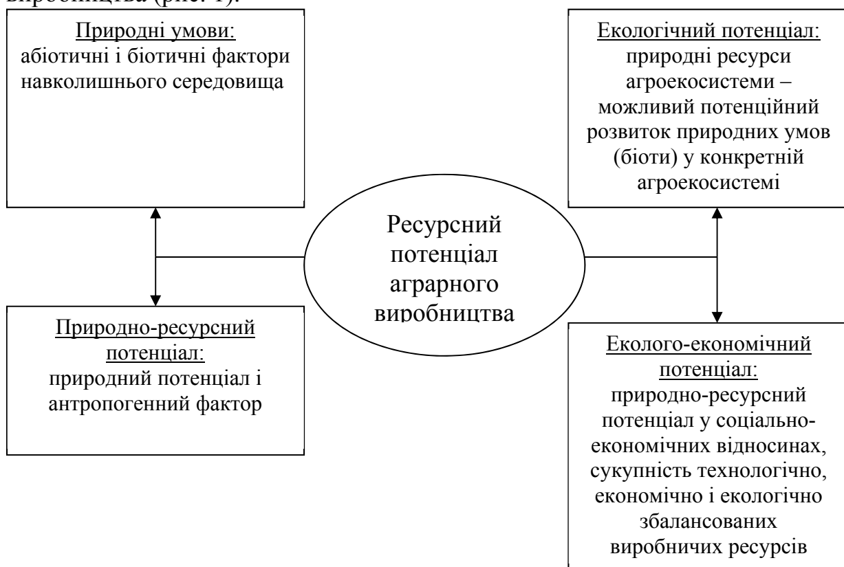
Рис. 1. Основні види ресурсного потенціалу аграрного виробництва

Нами були систематизовані основні види потенціалу аграрного виробництва (рис. 1).