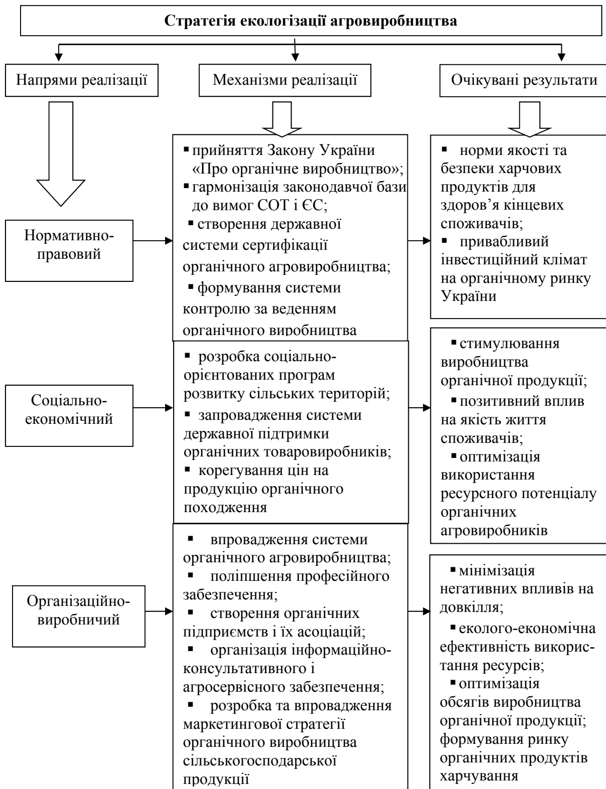
Рис. 4. Концептуальна модель формування стратегії екологізації агровиробництва підприємств України