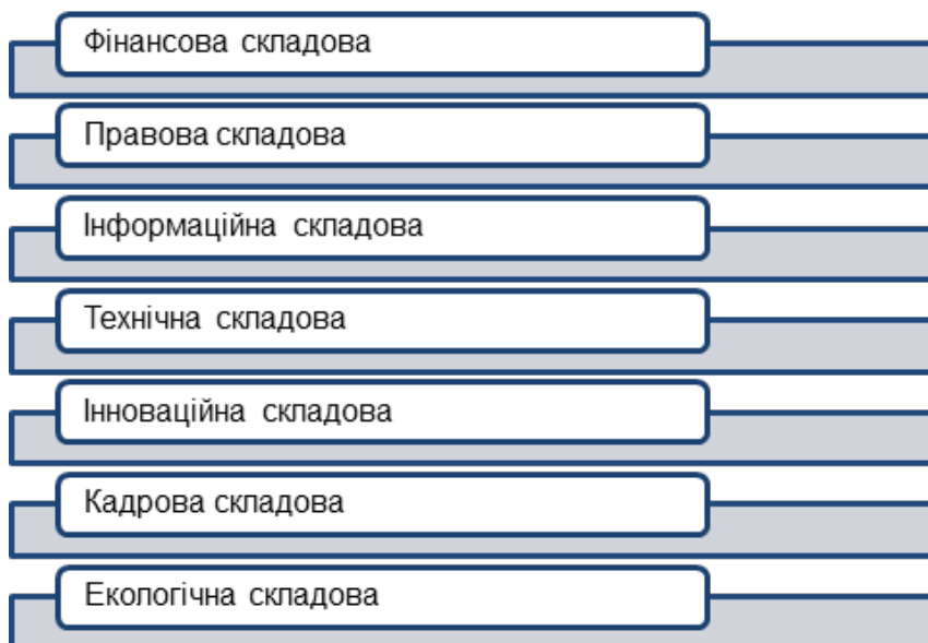
Рис. 2. Функціональні складові системи фінансово-економічної безпеки підприємства

Основоположним є вивчення функціональних складових фінансово-економічної безпеки підприємства (рис. 2).