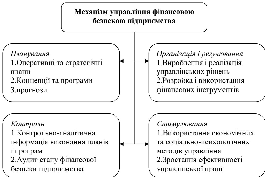
Рис. 2. Основні елементи організаційно-економічного механізму ФЕБ підприємства

персоналу, яка має відповідні повноваження для проведення діяльності по захисту фінансово-економічної безпеки.