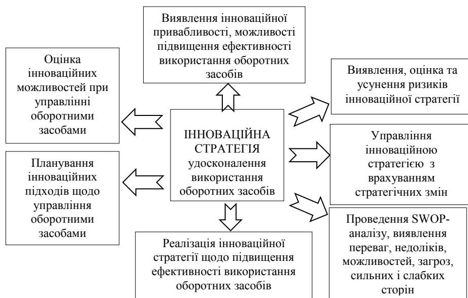
Рис. 2. Механізм формування інноваційної стратегії удосконалення використання оборотних засобів аграрного підприємства