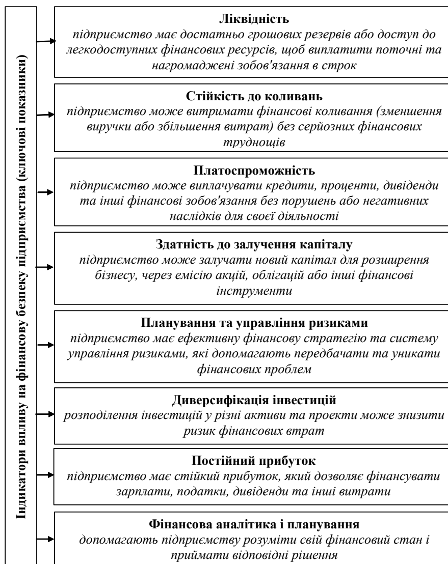
Рис. 1. Індикатори впливу на фінансову безпеку підприємства