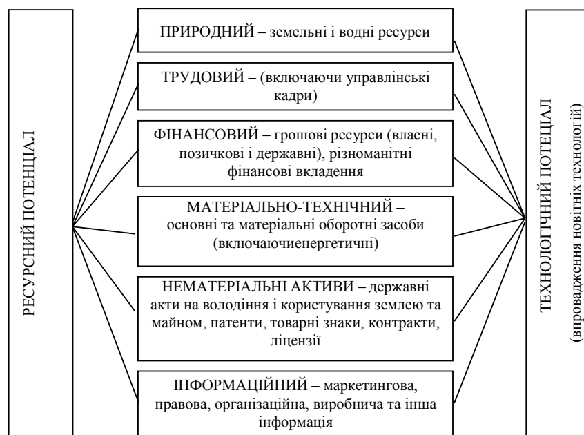
Рис. 1. Складові ресурсного потенціалу аграрного підприємства