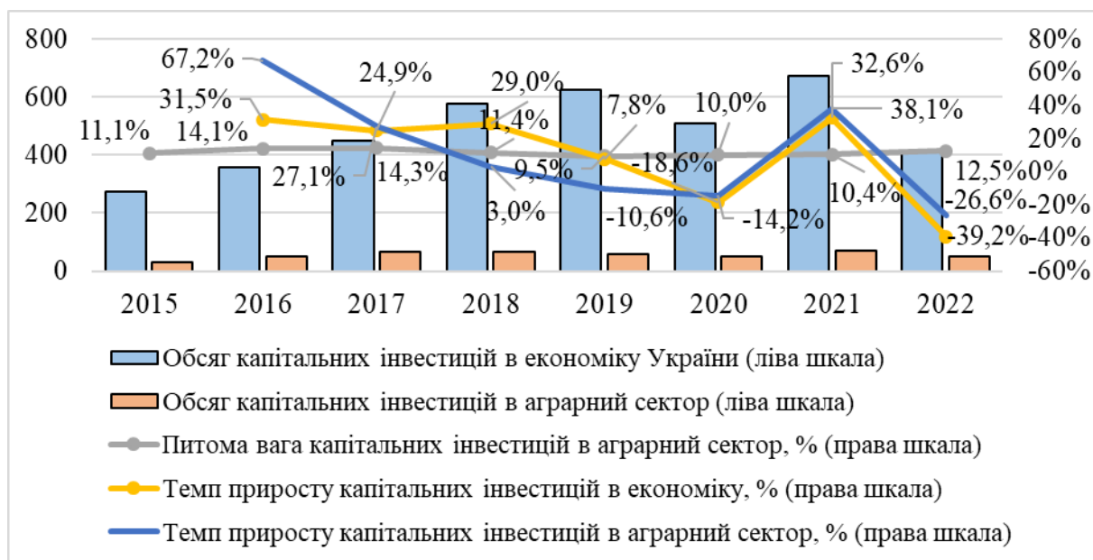
Рис. 2. Темп приросту та питома вага капітальних інвестицій в аграрний сектор економіки України за 2015-2022 рр., млрд. грн.

Найбільша питома вага капітальних інвестицій в аграрний сектор в загальних капітальних інвестиціях була в 2017 р. – 14,3%, а найменша в 2019 р. – 9,5%. І хоча в 2022 р. розмір інвестицій в аграрний сектор зменшився, їх питома вага зросла до 12,5%, вперше з 2018 р. коли питома вага знижувалась до 2021 р. (зниження з 2018 р. по 2021 р. становило 1 в.п.). Відповідно і темп приросту капітальних інвестицій в економіку в 2022 р. знизився на 39,2%, а темп приросту капітальних інвестицій в аграрний сектор – на 26,6%.